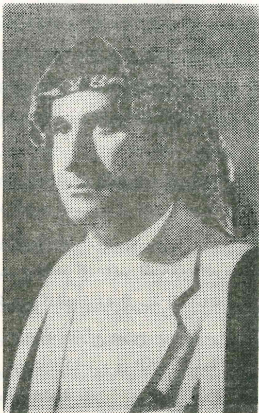
الشيخ عبد الله الخزل قائد ثورة سنة ١٩٤٠