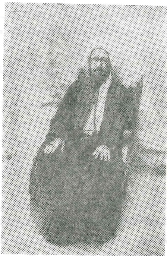
المرحوم الشيخ عبد المحسن الحافقاني الوارد ذكره في أحداث سنة ١٩٢٥